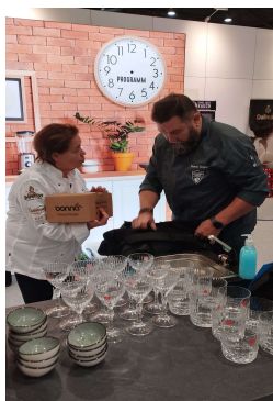
Vorbereitung ist alles!