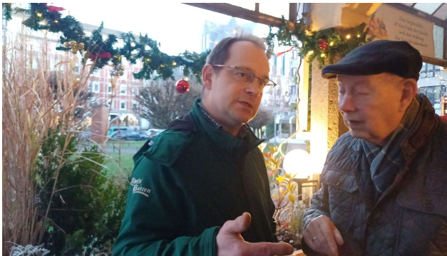
Vorsitzender und Ehrenvorsitzender im Gespräch

für alle, die sich im Jahr 2025 in die Vereinsarbeit eingebracht haben.